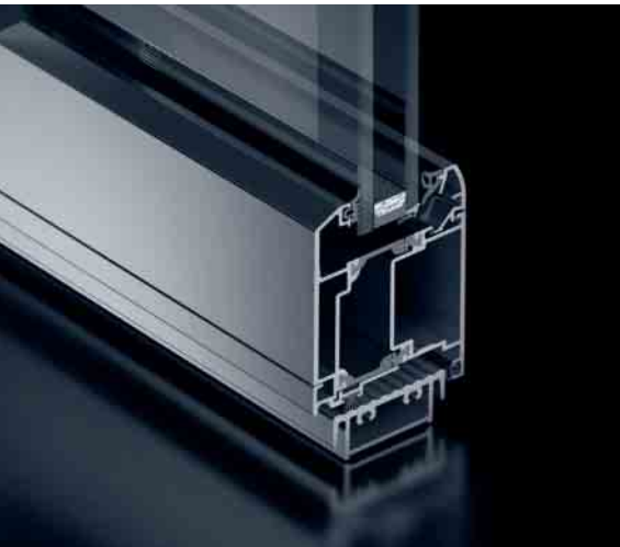
Schüco Tür ADS 65 RL Schüco Door ADS 65 RL