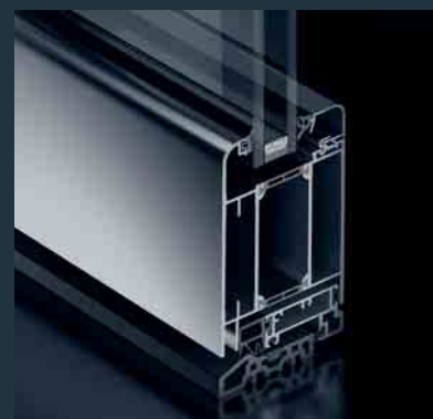
Schüco Tür ADS 65 SL Schüco Door ADS 65 SL

The Schüco Door ADS 65 is suitable for economical entrance solutions in conjunction with very good thermal insulation. Optional fittings allow it also to be used as a multi-purpose door and integrated in the building security and building management system. The modern design – for example, in the SL (Softline) version with rounded leaf contours – provides numerous design options for the building envelope.