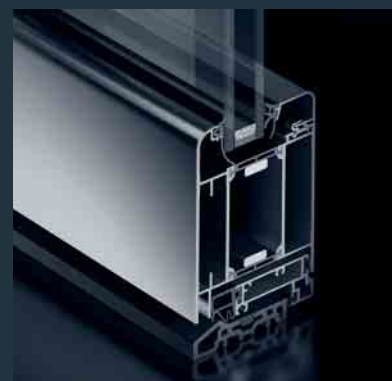
Schüco Tür ADS 70 SL.HI Schüco Door ADS 70 SL.HI

The Schüco Door ADS 70.HI (High Insulation) combines outstanding thermal insulation with the benefits of the Schüco ADS door systems. The basic depth of 70 mm ensures a high degree of stability. Optional fittings allow it to be used as a multi-purpose door and integrated in the building security and building management system. The timeless design is also available with rounded contours (SL version) and is ideal for combining with the Schüco façade and window systems.