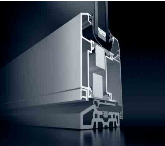
Schüco Tür ADS 70 RL.HI Schüco Door ADS 70 RL.HI